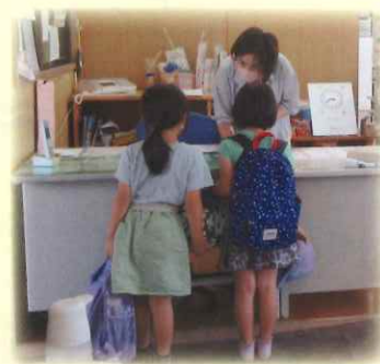
学童保育所就業の様子