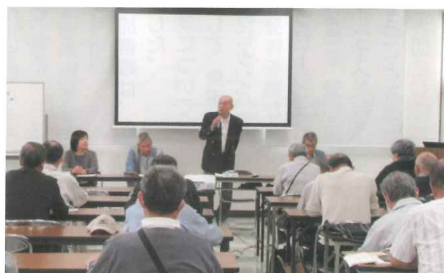
【職域班長会議の様子】

開催日時: 令和6年10月29日(火) 14:00～ 開催場所: 当センター2階 研修室