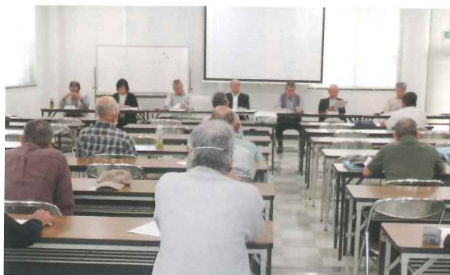
【職群班会議の様子】

開催日時: 令和6年10月24日(木) 14:00～ 開催場所: 当センター2階 研修室