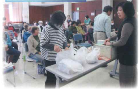
ビンゴ大会の様子

毎回好評いただいているヤクルト健康教室を開きました。バランスの良い食事の大切さを改めて知ることができました。そしてビンゴ大会では楽しい時間を過ごし、最後には旬のサツマイモなどたくさんのお土産があり笑顔で終わることができました。